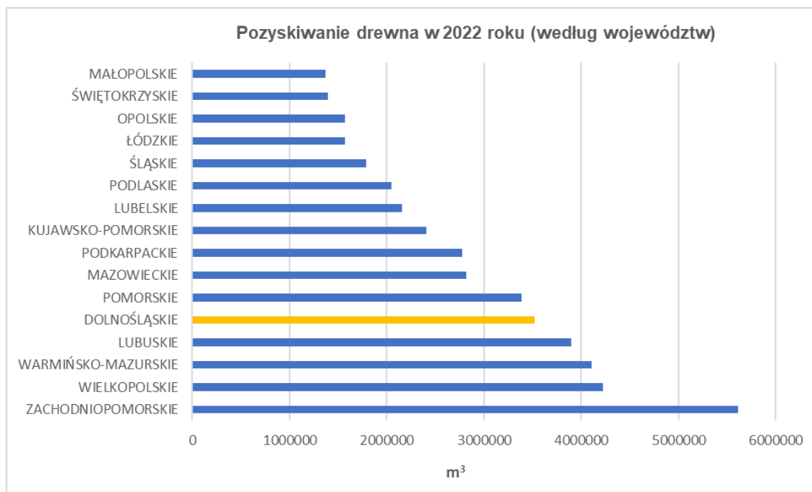
Rysunek 3. Pozyskiwanie drewna w 2022 roku (według województw) [według nadleśnictw].

Postępująca zmiana klimatu jest ważnym zagrożeniem dla drzewostanu. Spośród czynników klimatycznych i ich pochodnych najniebezpieczniejszymi są wzrost temperatury powietrza, coraz częściej występujące fale upałów, zmiany w rozkładzie opadów atmosferycznych oraz zanik pokrywy śnieżnej, przyczyniające się do powstawania suszy a także silne wiatry.